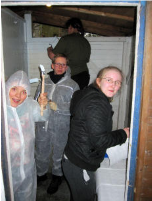
Streichen - Streichen