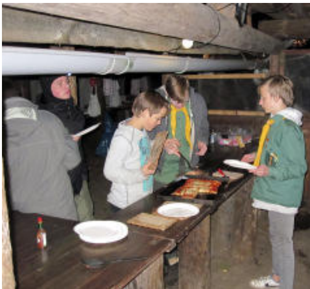
Welche Pizza nehme ich?