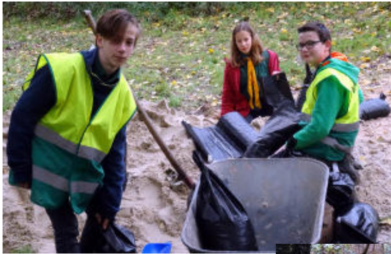
Sandsäcke füllen und hinter der Scheune lagern zum Schutz vor dem nächsten Starkregen im Sommer