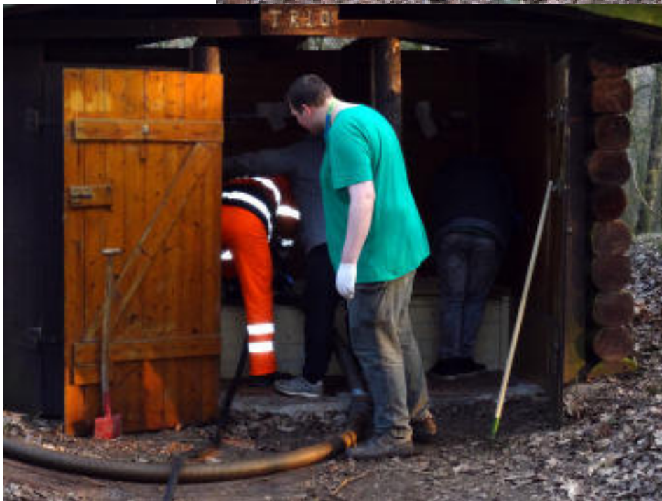
Entsorgen - und nach drei Stunden war alles vorbei!