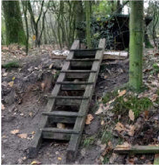
Bau unserer „Hintertreppe“